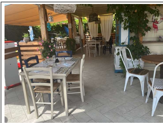
Tavoli bar ristorante